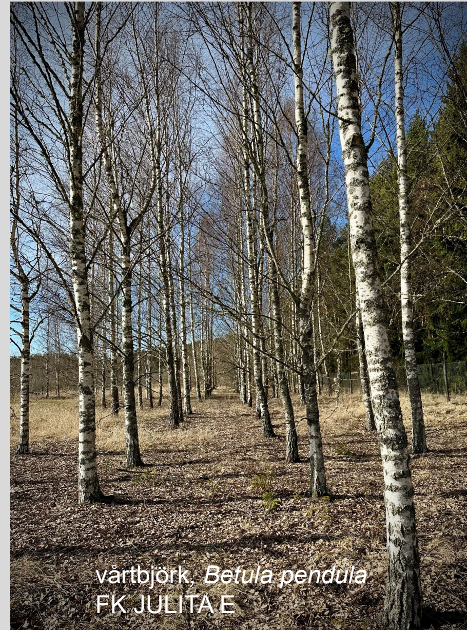
vårtbjörk, Betula pendula FK JULITA E