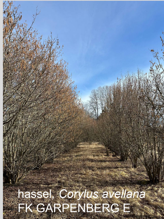
hassel, Corylus avellana FK GARPENBERG E