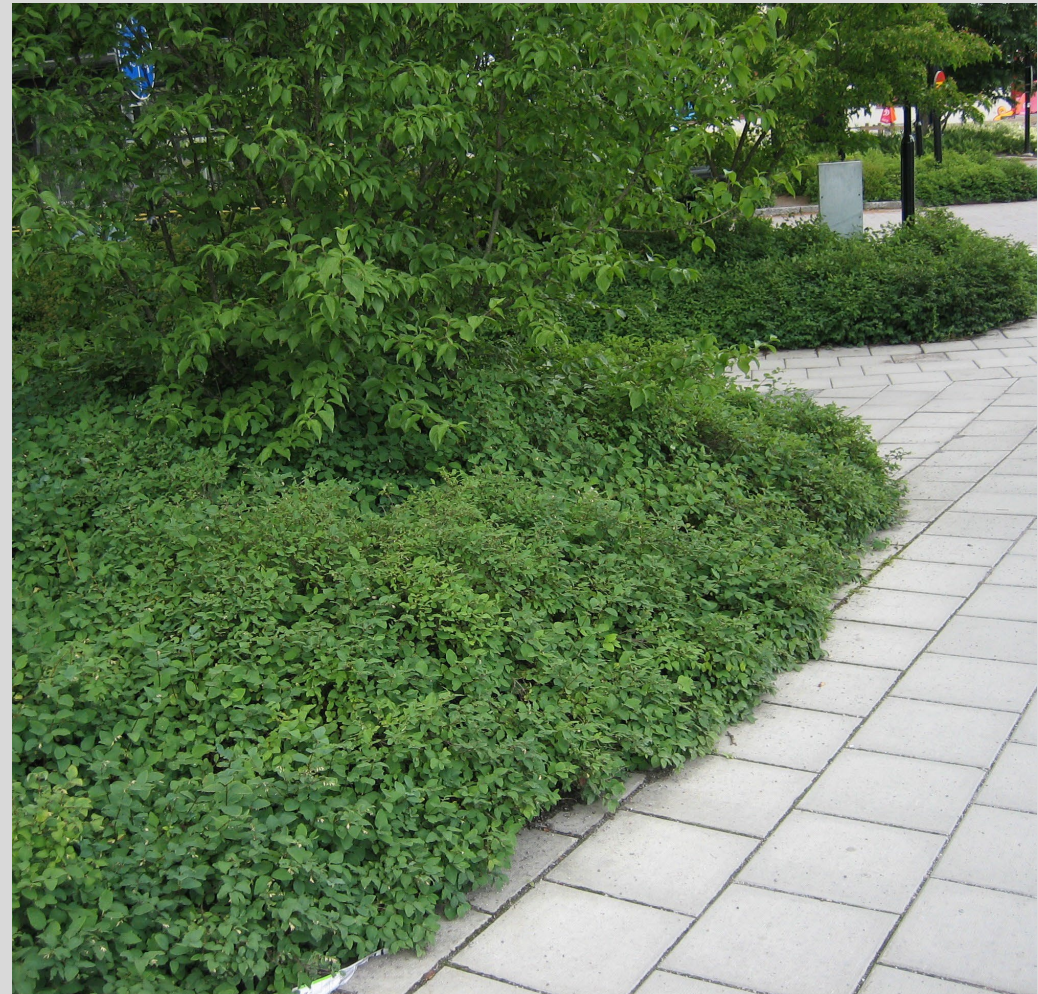
Prydnadssnöbär, Symphoricarpos , 'Arvid' E