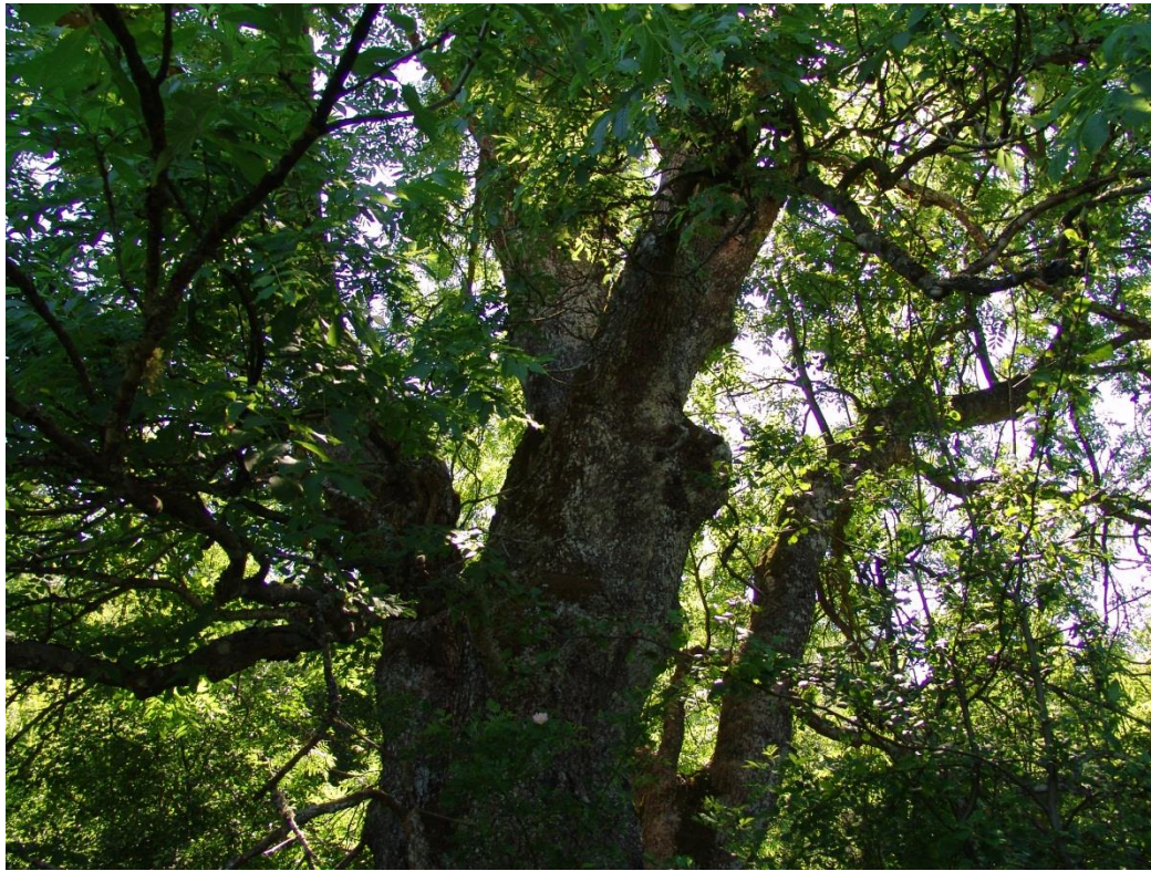
Ask vid Germundsmåla i östra Blekinge