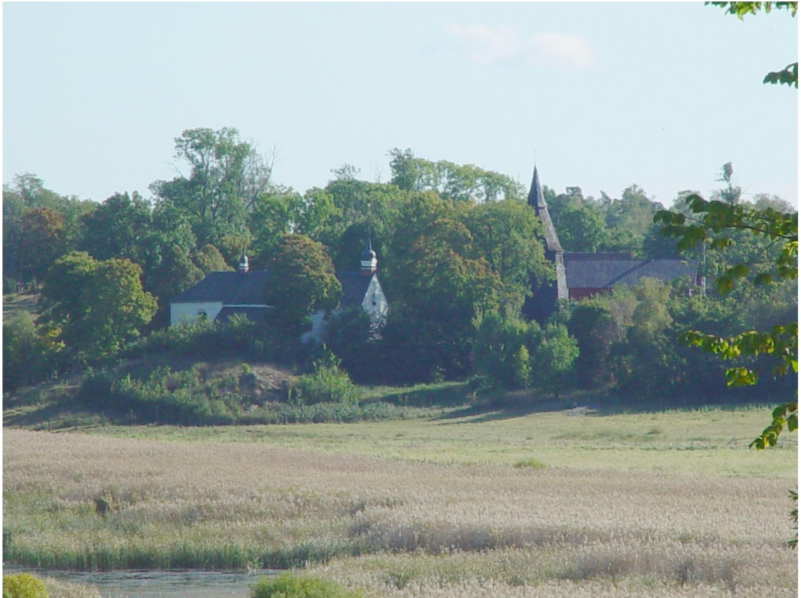
Dalby kyrka i Uppland