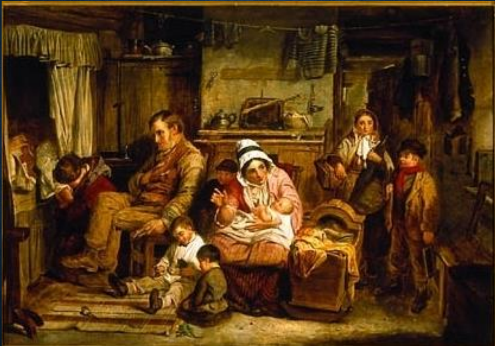
Kilian Zoll, "Sjukbädden", Bohusläns museum.