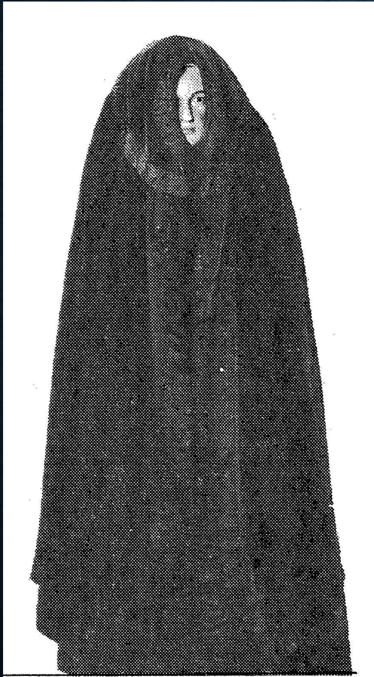
"Kåva från Torna härad", Kulturen i Lund.