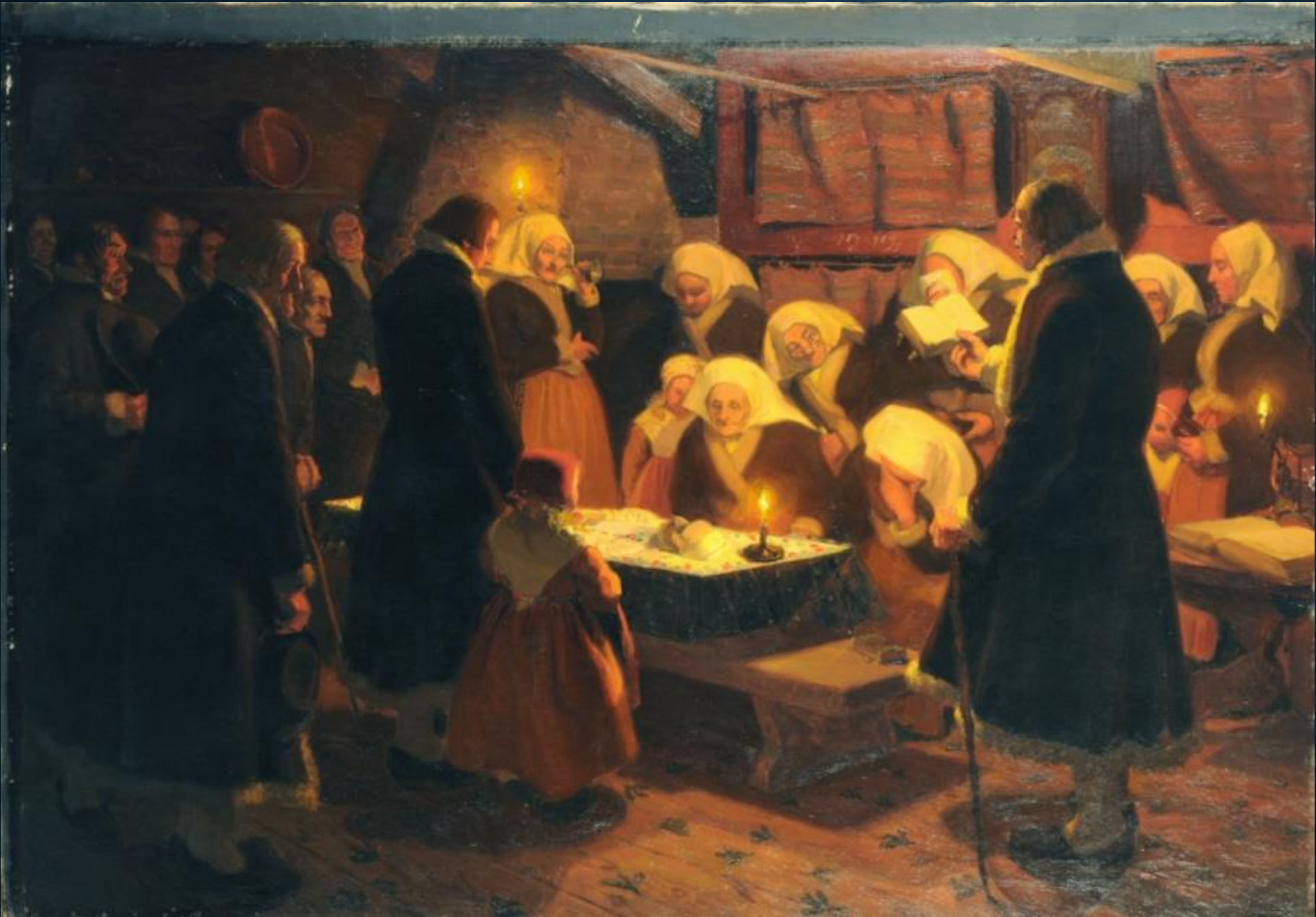
"Likvaka i Leksand" Emrik Stenberg, 1897. Göteborgs konstmuseum.