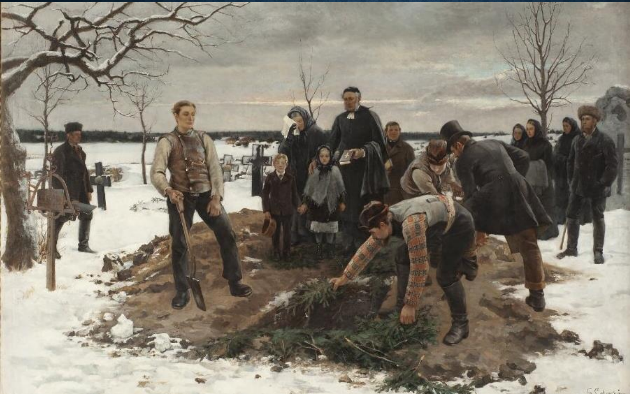
Begravning i Alsike”, 1883