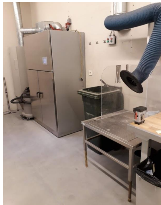
Bild 3 Partikelmätning vid askberedning