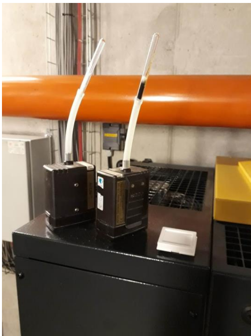
Bild 2 Stationär mätning vid rökgasrening