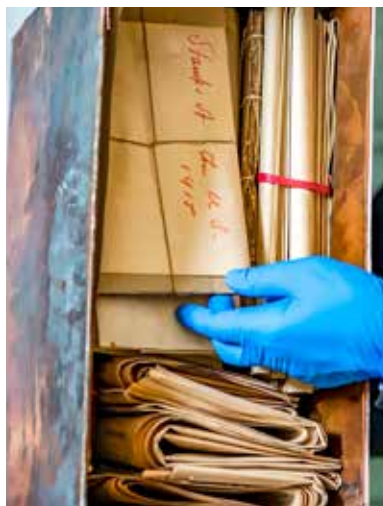
Innehållet i tidskapseln på Arlingtonkyrkogården – papper, mynt, tyg med mera – var välbevarat i sitt mjuka omslagspapper. Ingen fukt eller mögel fanns i lådan.