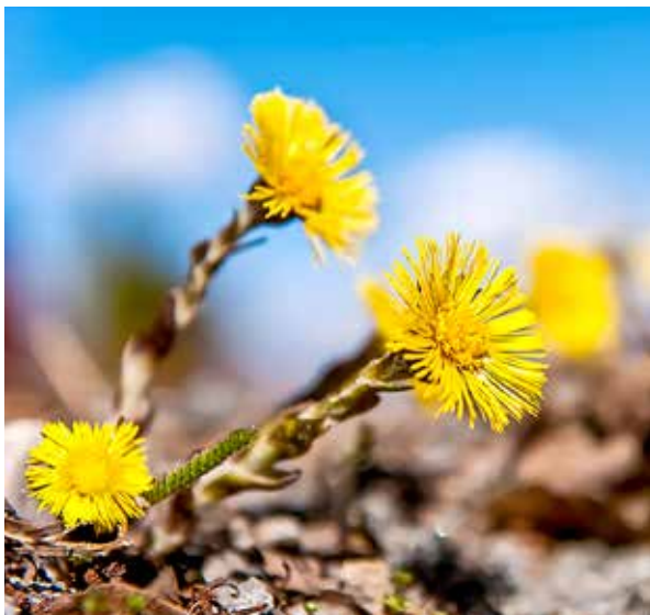
Hästhov eller tussilago ( Tussilago farfara ), beskrevs av Carl von Linné och placeras i dag som ensam art i släktet hästhovar.