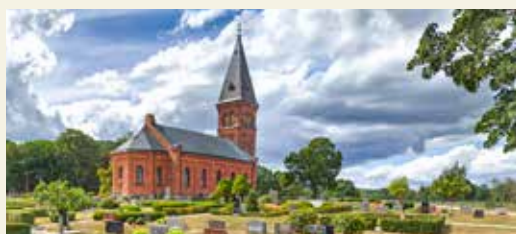
Ignaberga nya kyrka utanför Hässleholm.