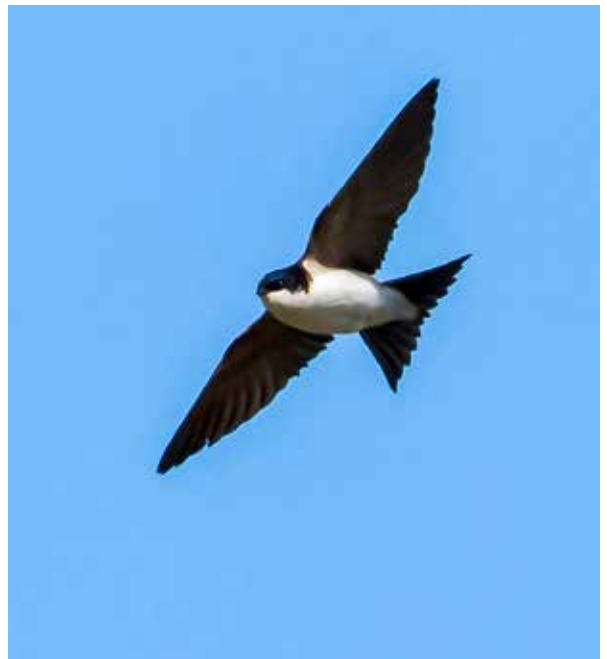
Hussvala ( Delichon urbicum ) är klassad som sårbar.

En snabb sökning i webbdatabasen på "Urban miljö", dit bland annat trädgård hör, visar bland annat på en rad hotade bi-arter. En annan är den blommande växten Flockarun ( Centaureum erythraea ), som under rödlistans tjugo år har funnits med hela tiden som nära hotad. Detsamma gäller fjärilen mindre blåvinge ( Cupido minimus ). Även hussvalan ( Delichon urbicum ) syns alltmer sällan. JOHAN LINDSTÉN