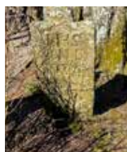
Koleragravminnet, Båraryds kyrkogård.

Det är främst begravningshuvudmän i landet sydvästra delar som just nu valt ut gravar att berätta mer om för kyrkogårdens besökare via korta filmer med en berättande text och som kan spelas upp i mobiltelefonen.