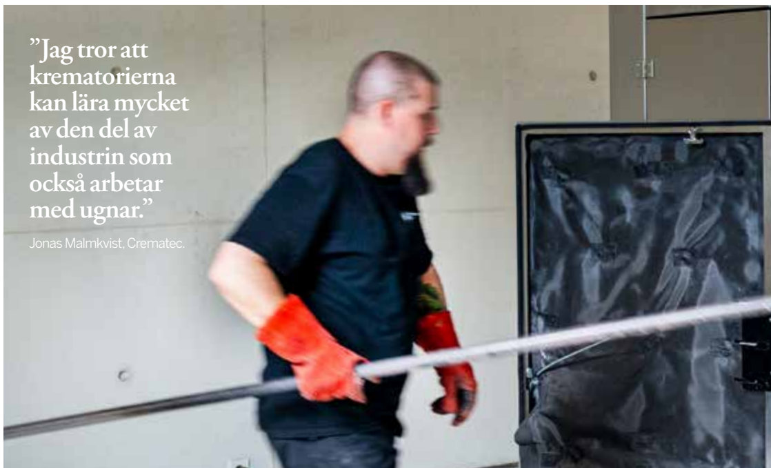
Planerade serviceintervaller, utbildning och moderniseringar är några faktorer som de leverantörer som Kyrkogården har talat med