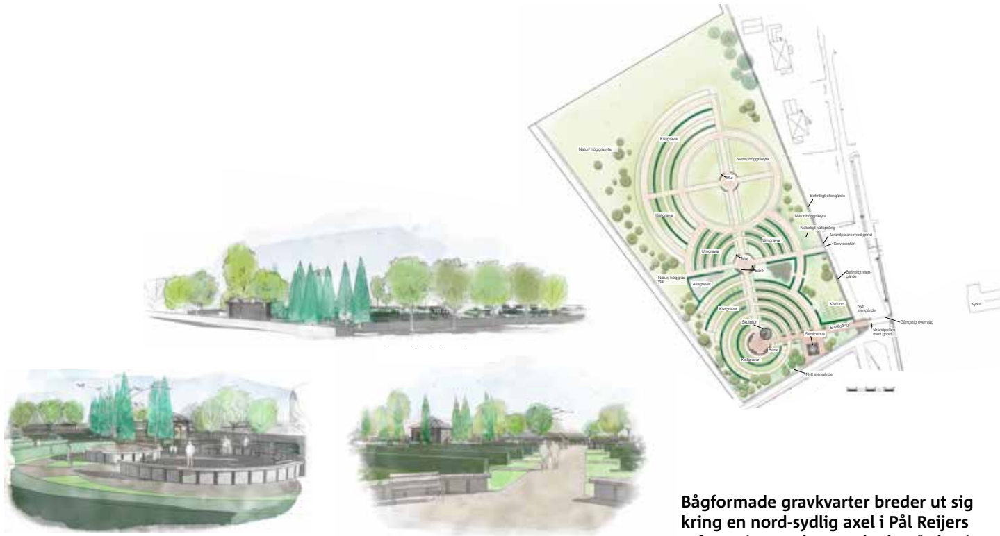
Bågformade gravkvarter breder ut sig kring en nord-sydlig axel i Pål Reijers utformning av den nya kyrkogården i Söndrum.