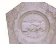
Handbok för kulturhistorisk inventering, bevarande och återanvändande av gravanordningar