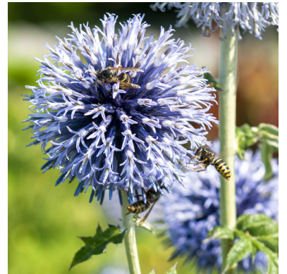
Bin på jakt i blomstergården.