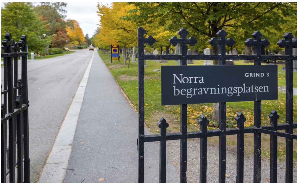
Efter misshandeln på Norra begravningsplatsen undersöker förvaltningen i Stockholm om grindarna kan stängas nattetid.