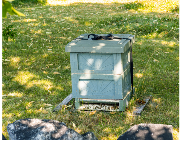
◀ Munsö kyrka är en rundkyrka från slutet av 1100-talet med ett försvarstorn åt ärkebiskopen, som då ägde Bona gård strax intill. ▲ Bikupan arrenderas av en biodlare i trakten. Den nektar som bina samlar in kommer från församlingens egen blomstergård. ▶