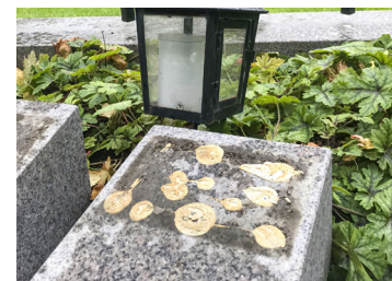
Bara stenfundamenten återstår efter stölden av bronsplattorna i Falun.

Senare har två mässingsplattor stulits vid Norslunds kyrkogård. I båda fallen inväntar man vad polisen kommer fram till. (JL)