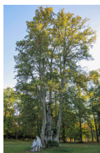
Parkliinden "Kristina" E.

Sorterna som saluförs under varumärket har odlats i Sverige före 1940, 1950 eller 1960, beroende på växtslag, och till dem finns ofta både traditioner, berättelser och lokala namn knutna. ■