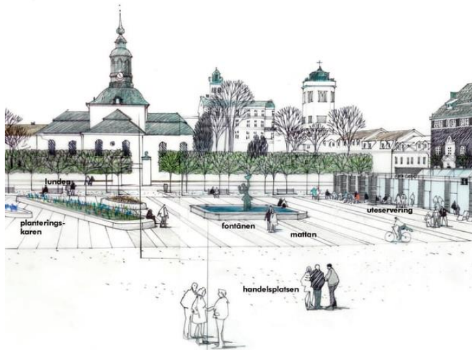
RTORGET I KARLSHAMN

Miljöer som är synbart gamla och bär många spår av tidens tand.