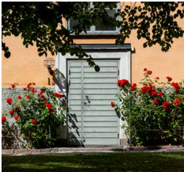
En klassisk, urban miljö med gröna inslag.

DET SOM I BRYTNINGEN mellan 70- och 80-tal ledde fram till att Movium skapades, var bland annat efterkrigstidens och välfärdsbyggets massiva bostadsbyggande med modernismens ideal, där städerna tenderade att svälla på bredden med stora förstadsområden och växande grönytor som fick skötselkostnaden