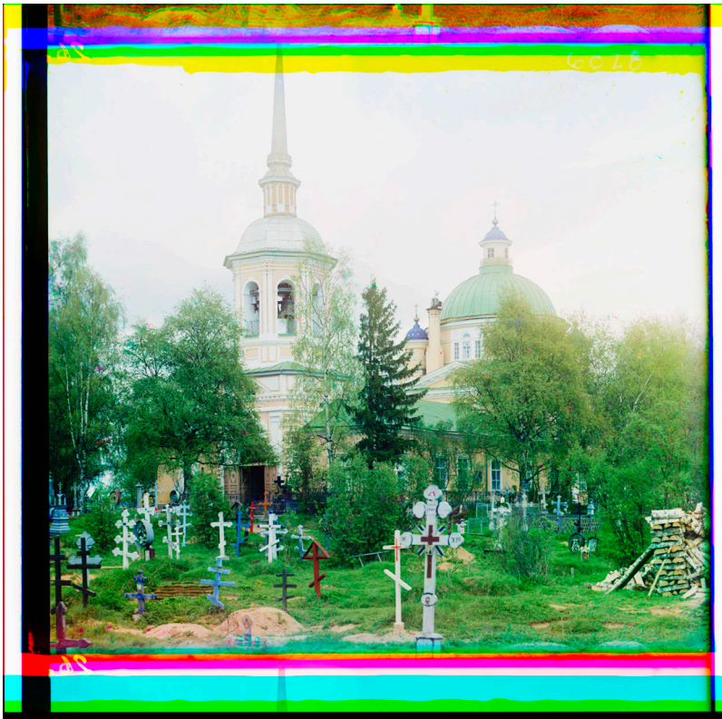
1910 fotograferade Sergej Prokudin-Gorskij kyrkogården och Kyrkan till det heliga korsets upphöjelse i staden Ostashkov, 35 mil nordväst om Moskva i Ryssland. De starka färgerna i bildens ram är rester från arbetet med att lägga samman de tre bilderna till en.