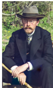
Ett självporträtt från cirka 1912.

Den här tekniken anammade Prokudin-Gorskij. Det är dock oklart om han lät bygga en egen kamera eller om han köpte en från Miethe-Bermpohl. Vad som däremot är klart är att han vidareutvecklade tekniken i både kamera och