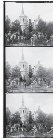
De tre negativa bilder (blå, grön, röd) som ihop ger bilden till vänster.