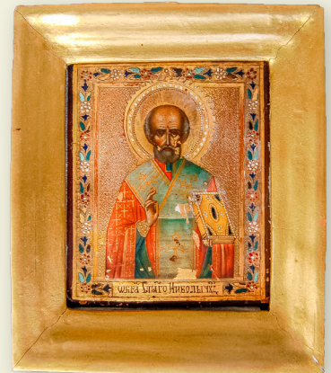
"Sankt Nicholas mirakelgöparen" säger texten på denna ryska ikon från slutet av 1800-talet.

Om de turkiska forskarna, som hävdar att de relikerna som rövades till Italien för drygt 930 år sedan är någon helt annans, har lyckats ta sig in i det underjordiska kapellet i Demre förtäljer inte historien. (TL)