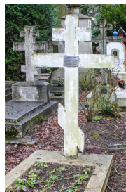
Sergej Prokudin-Gorskij levde mellan 1863 och 1944 och är begravd på den ryska delen av Sainte-Geneviève-Bois-kyrkogården i Paris.