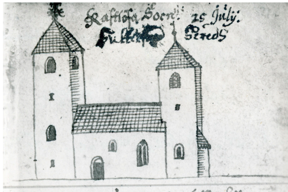
Den klövsadlade Kastlösa kyrka – med två torn, ett i öster och ett i väster – år 1634 på en bild av arkeolog Johannes Haquini Rhezelius. Kyrkan ersattes av den nuvarande kyrkan 1855. (Bildens beskuren i nederkant.)

Lasses Birgitta går till historien som ett ovanligt fall, både utifrån det faktum att hon sannolikt kan ha varit den första kvinna som dömdes till döden för häxeri eller trolldom i landet, dels för