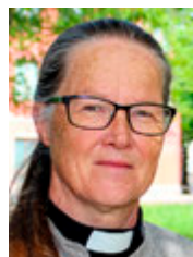
Åsa Nyström, biskop i Luleå stift.

handlande i relation till det samiska folket i historia och nutid.”