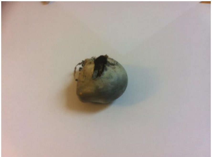
Provbränning PM 4