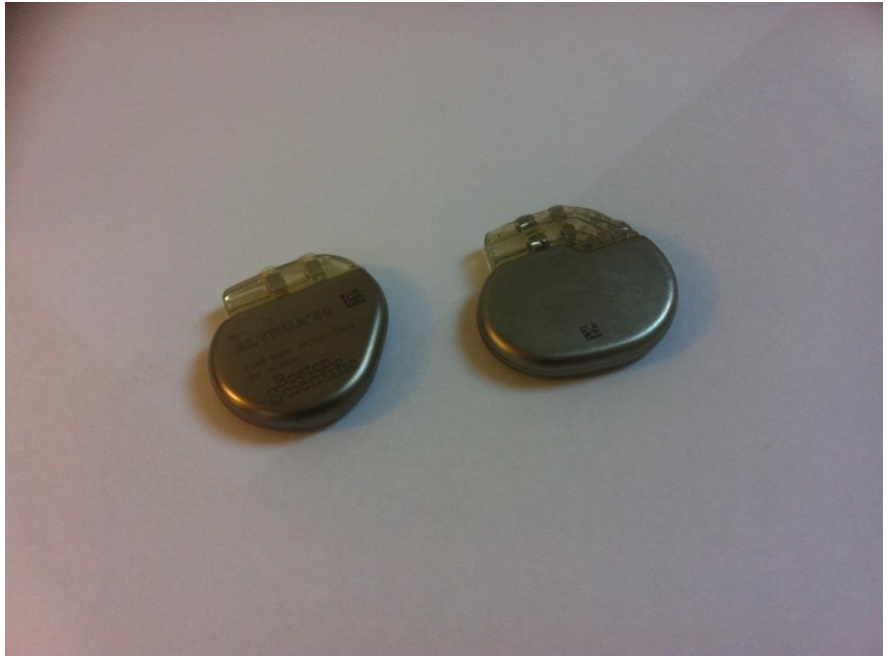
Modell Pacemakers 1 och 3