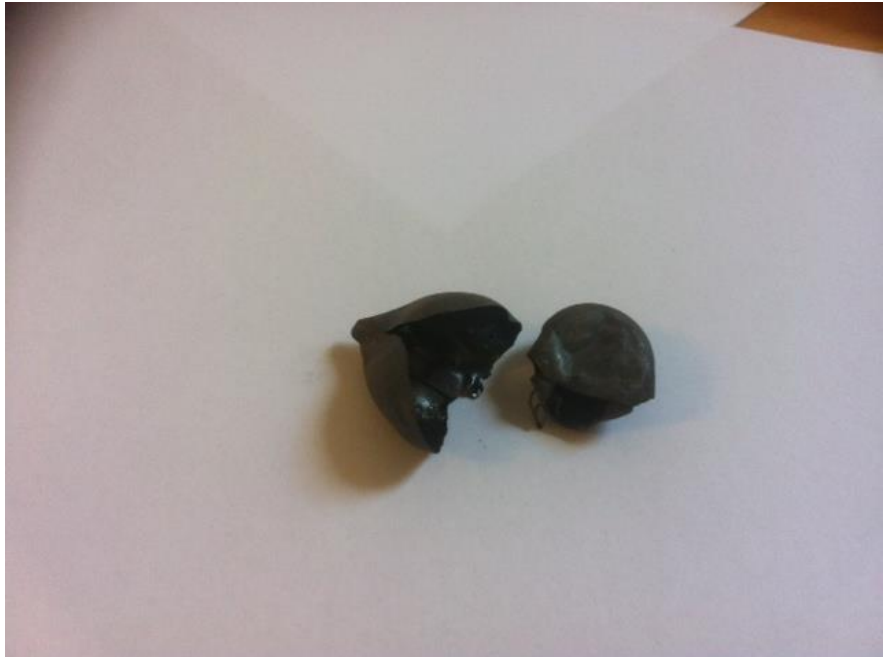
Provbränning PM 3