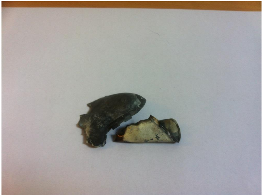
Provbränning PM 1