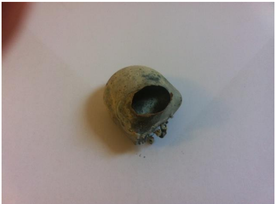
Provbränning PM 2