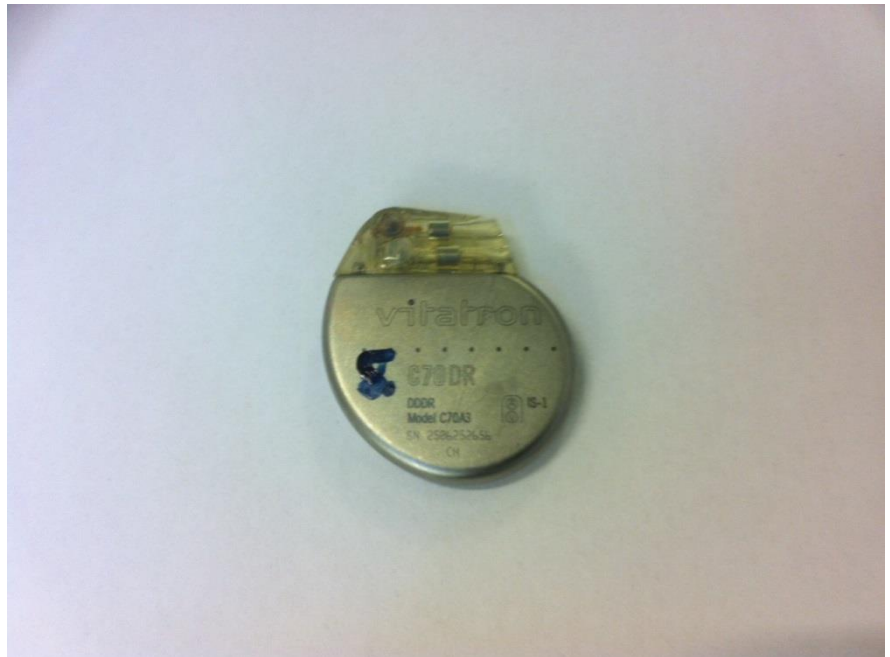
PM 5 Nya krematoriet